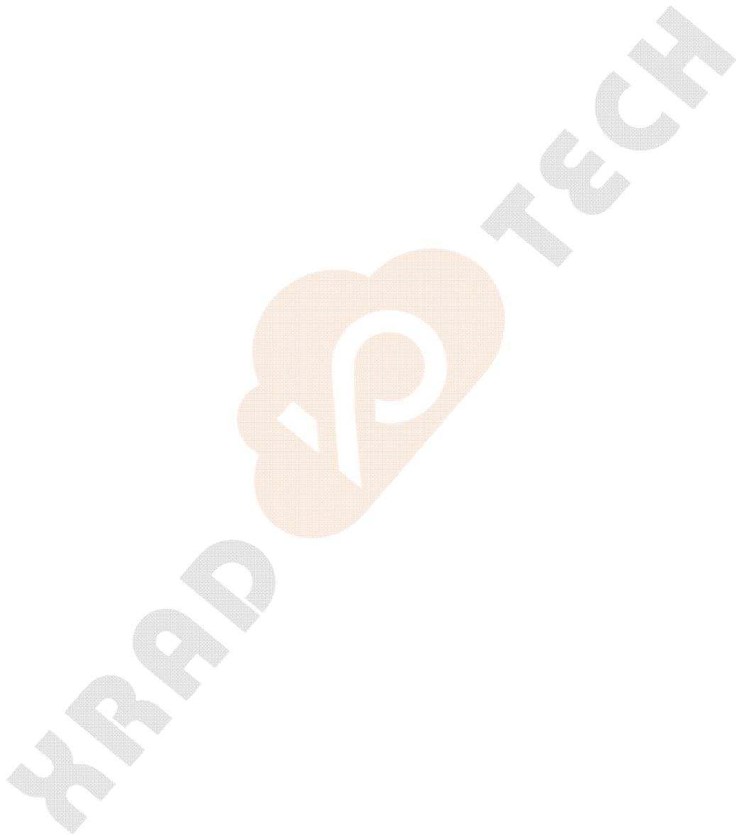
Table Revision History